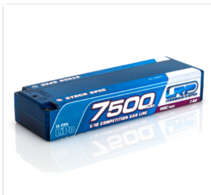
LRP 7500 - TC Stock Spec - 110C/55C - 7.4V LiPo

CONSULTA LAS SIGUIENTES PÁGINAS PARA MÁS DETALLES