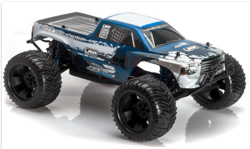
LRP S10 Twister 2 MT Brushless 2.4Ghz RTR

YA DISPONIBLES EN TU TIENDA DE HOBBY AKTUELL