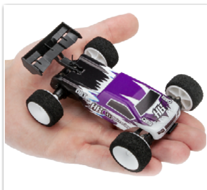
HPI Q32 D8T RTR Tessmann Edition 1/32 Truggy

Búsqueda de tiendas Aktuell en: www.LRP.cc