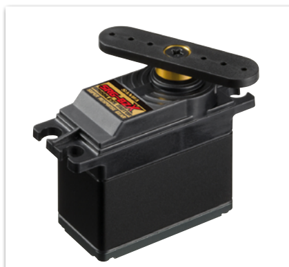
Sanwa SRG-BZX Servo (15kgcm/0.06s/40, 7.4V)