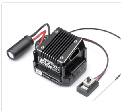
Sanwa SV-Plus Type-D Regler/ RX-472 Empfänger

CONSULTA LAS SIGUIENTES PÁGINAS PARA MÁS DETALLES