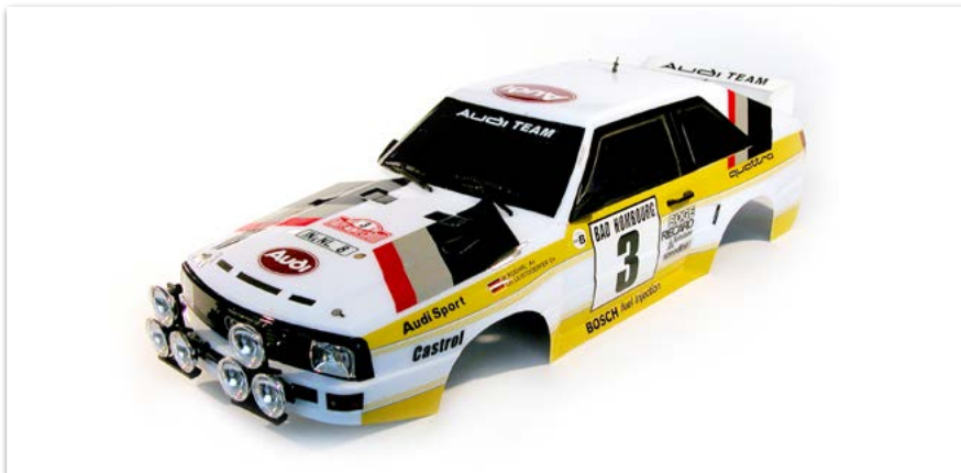
Audi Quattro Karosserie Audi-Team