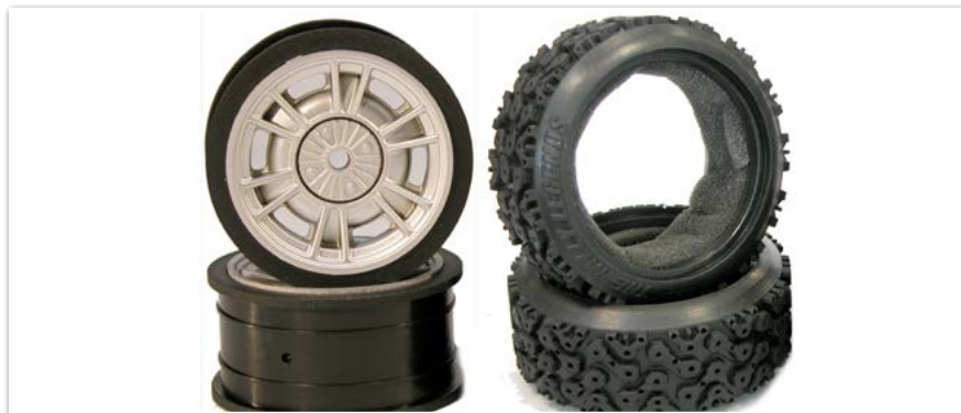
Felgen Set Fiat 124 Abarth & Rally Reifen Set