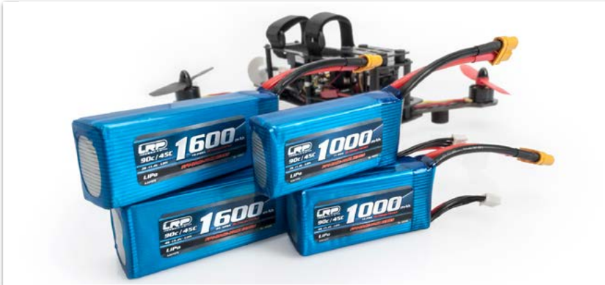
FPV-Race-Pack Series 90C/45C High Voltage